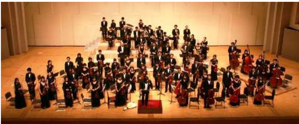
(2007.9 第3回定期演奏会より)

団員一同、常に質の高い演奏の実現を目指し、皆様のご支持をいただけるアマチュア・オーケストラとして成長していきたいと考えておりますので、ご声援のほど宜しくお願い申し上げます。